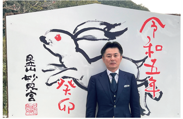
株式会社正栄電設工業 代表取締役

さて、本年の干支は「癸卯(みずのと・う)」です。「癸(みずのと)」は、太陽を象徴とした生命の循環を表す十干「甲・乙・丙・丁・戊・己・庚・辛・壬・癸」の10番目に位置します。「癸(みずのと)」は生命の循環で言えば最後に位置し、次の生命を育む準備が完了した状態を表している。また「卯(う)」は、月を象徴とした生命の循環を表す十二支「子・丑・寅・卯・辰・巳・午・未・申・酉・戌・亥」の4番目に位置します。「卯(う)」は萌え出る春のイメージで、草木が地面をおおうようになった状態を表している。また「癸(みずのと)」と「卯(う)」は「癸(みずのと)」が「卯(う)」を補完し生かす関係にあり、厳冬が去り春の兆しが訪れたことを表している。つまり既に春の兆しは始まっていて、これ